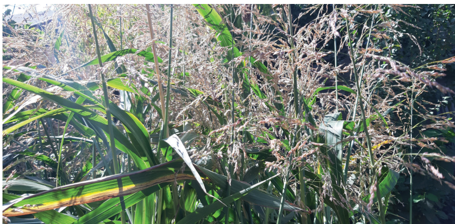
Рис 2. Многолетний сорт сорго «Азамат»

Агротехнические приемы возделывания многолетнего сорго не отличаются от агротехники сорго зернового и сахарного. После уборки предшествующих культур на поля вносят 25-30 т навоза, и проводят осеннюю вспашку на глубину 28-30 см. На засоленных почвах необходимо проводить промывку. Поливы необходимо провести с учетом уровня грунтовых вод, меха-