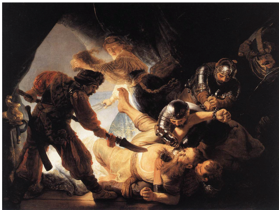
Рисунок. Ослепление Самсона, 1636 г., Рембрандт.

жо сразу привлекла внимание нового поколения режиссеров и операторов немого кино. С развитием технологий и появлением осветительного оборудования, способного создавать сильный поток света, они стали стремиться делать масштабные кадры, эпизоды, освещать большие площади.